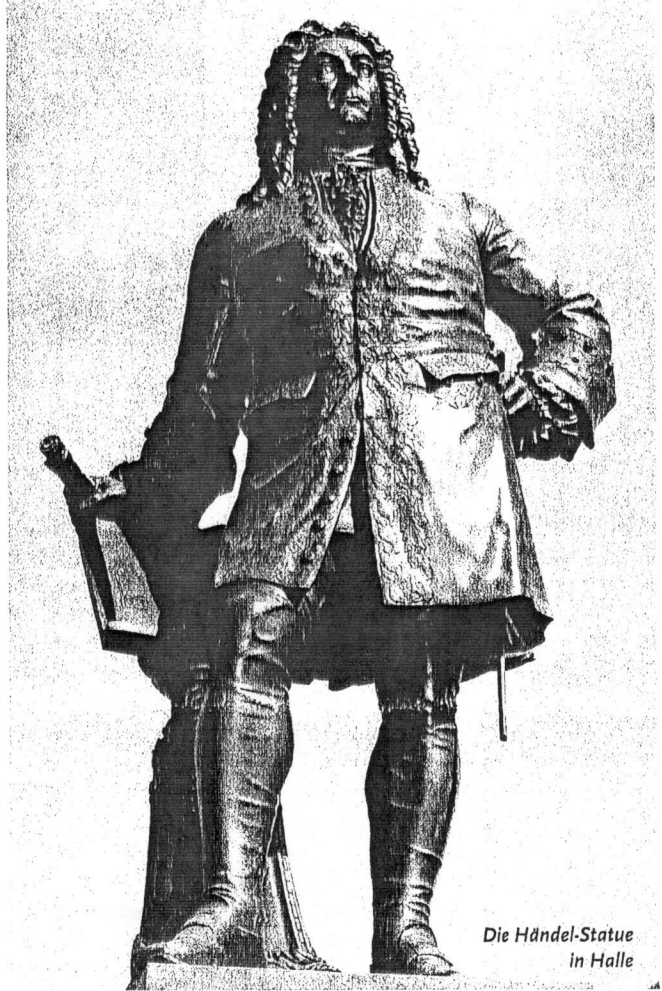
Die Händel-Statue in Halle